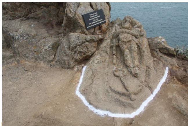
Cote d'Emeraude 4465 - ROTHENEUF - Le Calvaire de l'Ermitte - G. F.