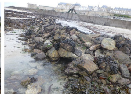
La pêcherie de Bonsecours, visible depuis les remparts à marée basse, est constituée d'un muret en pierres dites « sèches ».